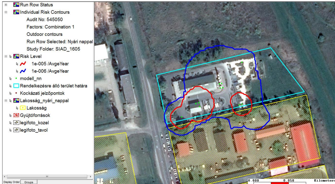
1. ábra: A halálozás egyéni kockázat görbéi a SIAD Hungary Kft. telephelye körül.

Az egyéni kockázatok tekintetében megállapítható, hogy az összesített hatások alapján számított 1E-5 /év és 1E-6 /év egyéni kockázati görbék a SIAD Hungary Kft. miskolci telephelyén kívül csak ipari területeket érintenek.